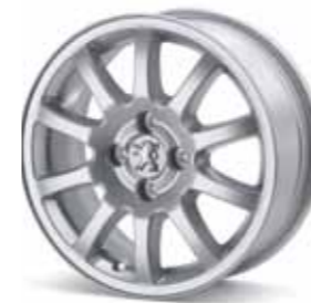
Lichtmetalen velg 15" Twelve

Lichtmetalen velgen zijn bij uitstek geschikt om uw bedrijfsauto een stijlvolle en persoonlijke uitstraling te geven.