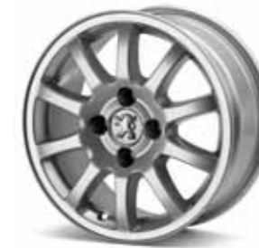
Lichtmetalen velg 15" Twenty First