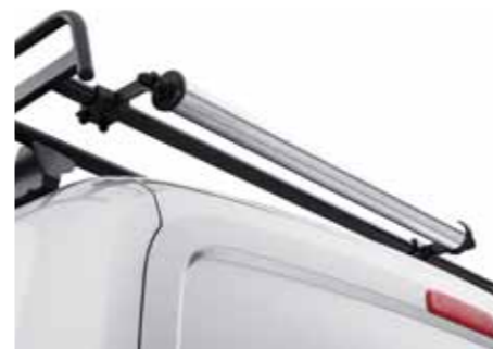
Extra laadrol Bipper