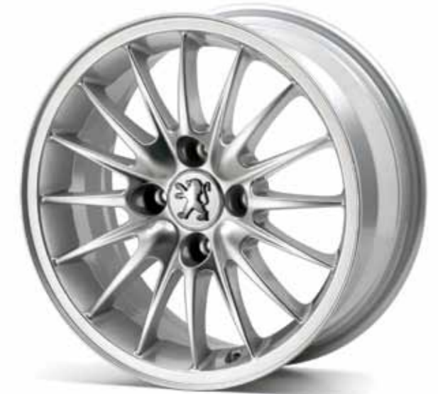
Lichtmetalen velg 15" Jet