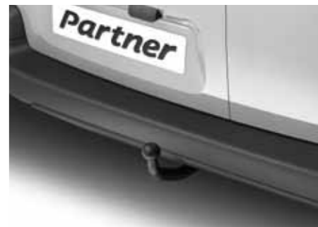
Trekhak met zwanenhalskogel