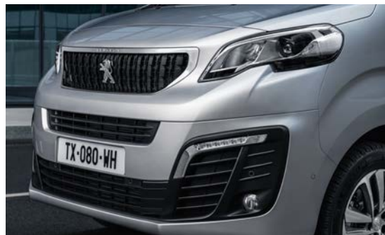
Afgebeeld is Pack Look 2 met 17inch Lichtmetalen velgen